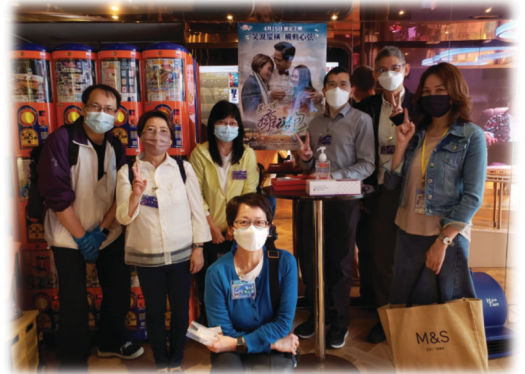
〈等一個擁抱〉聚會事奉人員合照

方是對等的。雙方均需進入對方的空間，抱著對方和被抱，雙方在同時的施予與接受中彼此認同對方，亦從中肯定自我，共同成長。最後是再度張開雙臂。這動作表示雙方的交往並非以消除雙方的差異為目的，使自我消失於一模一樣的「我們」之中，並同時回復起初張臂伸向對方的姿態，邀請下一次的交往。