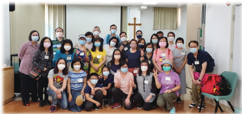
受苦節外展佈道行動出隊前合照

與神和好，經歷小兒子被父親接納的擁抱！（路十五20：「相離還遠，他父親看見，就動了慈心，跑去擁抱他，連連親他。」）